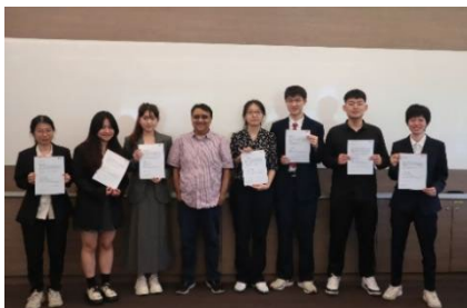
颁发优秀学员证明